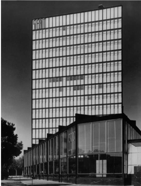
Figura 7. Almacén de coches de la Filial de Barcelona.

9. “No recuerdo los motivos por los que en el depósito de coches en Madrid incorporamos el brisoleil. Esos brisoleils en aluminio los fabricaba ya entonces CASA en serie y quizás tuvo mi padre interés en que sirviera allí de propaganda”. (ORTIZ-ECHAGÜE, 2014). GALLO, Jesús. Entrevista a D. César Ortiz-Echagüe Rubio. 17 abr. 2014.