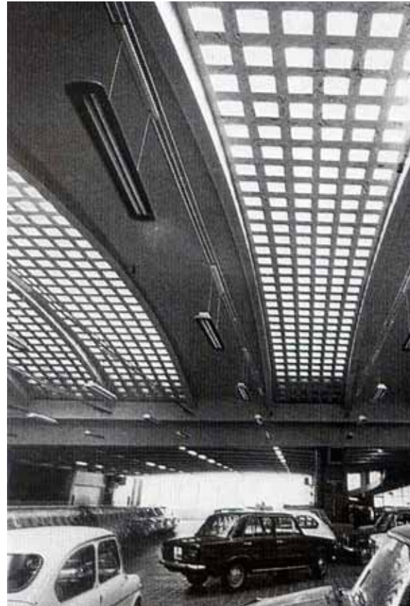
Figuras 12 (esq. arriba), 13 (esq. abajo) y 14 (arriba). Filial de Bilbao. De izquierda a derecha: fachada del bloque de oficinas, rampa del depósito de coches y talleres.

dición local. A diferencia del resto de edificios de SEAT, la filial de Bilbao se dispuso en una parcela entre medianeras con un gran patio interior cubierto que separaba el bloque de oficinas y el almacén de coches. Cada una de las tres piezas contaba un elemento singular: la fachada de oficinas hacia la avenida Lehendakari