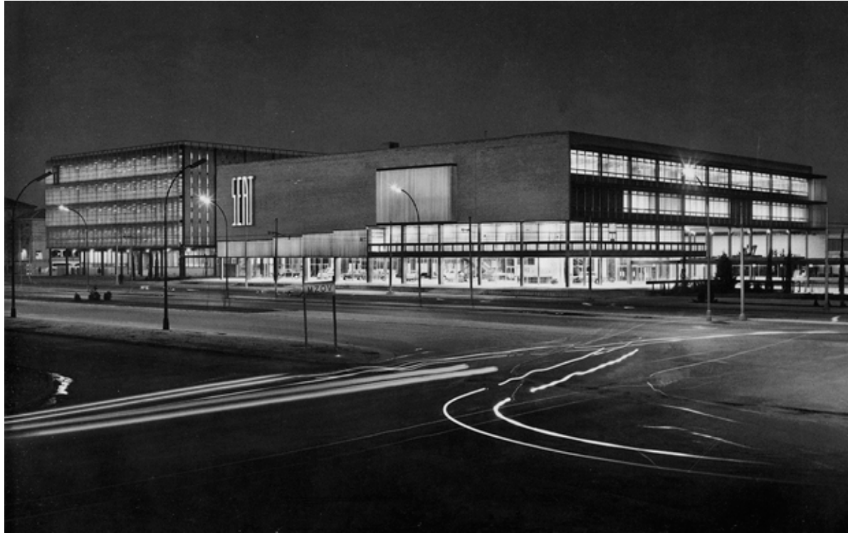
Figura 9. Perspectiva de la Filial de Madrid desde el Paseo de la Castellana, donde se puede observar el depósito de vehículos (izquierda) y las oficinas con auditorio (derecha).

bastante inferior a la que cinco años después conseguiría la casa OMES en el almacén de la filial de Madrid. (ORTIZ-ECHAGÜE, 2000, p. 26).