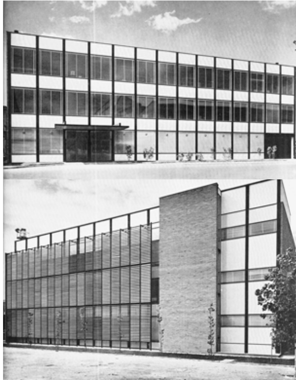
Figuras 4 y 5. Edificio de laboratorios. Fachadas norte y sur.