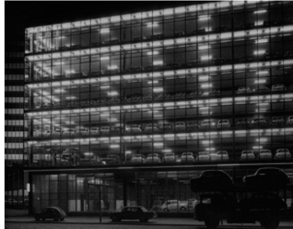
Figura 8. Torre de oficinas y pabellón de exposición y venta.

9. “No recuerdo los motivos por los que en el depósito de coches en Madrid incorporamos el brisoleil. Esos brisoleils en aluminio los fabricaba ya entonces CASA en serie y quizás tuvo mi padre interés en que sirviera allí de propaganda”. (ORTIZ-ECHAGÜE, 2014). GALLO, Jesús. Entrevista a D. César Ortiz-Echagüe Rubio. 17 abr. 2014.