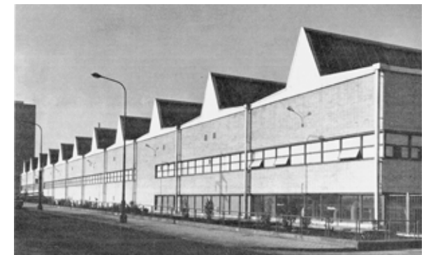
Figura 10. Perspectiva general de los talleres de la filial de Madrid vistos desde la actual calle de Mauricio Legendre.

En la década de 1960, SEAT se encontraba en un magnífico momento, produciendo modelos tan exi-