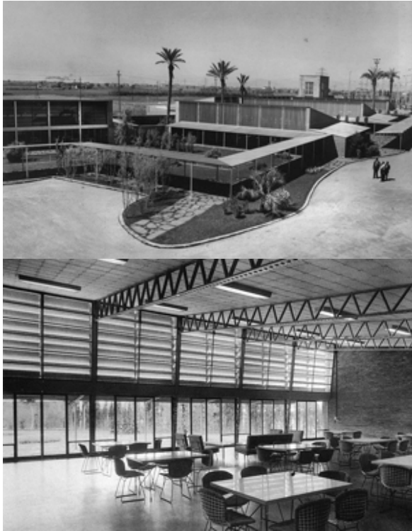
Figuras 1 y 2. Comedores para empleados en la Zona Franca de Barcelona.

2. Edificio publicado en el número 138 de la revista madrileña RNA (1953). Precisamente, el mismo año en que Ortiz-Echagüe, Barbero y de la Joya comenzaban a proyectar los comedores de Barcelona.