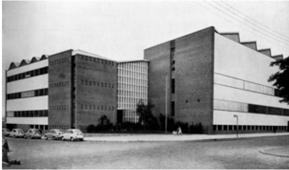
Figura 3. Escuela de aprendices para empleados de la SEAT en Barcelona.

3. La arquitectura española ya había obtenido importantes galardones en el extranjero durante aquella época. En concreto, destacaron los premios de José Antonio Coderch con Manuel Valls, Ramón Vázquez Molezún y Javier Carvajal con José María García de Paredes, en la Trienal de Milán de 1951, 1954 y 1957, respectivamente (FLORES, 1961, p. 207). Pero éstos posiblemente no tuvieron la envergadura, a nivel internacional, del Reynolds. España se situaba dentro del mapa de la arquitectura moderna y, un año después, José Antonio Corrales y Ramón Vázquez Molezún afianzarían este hecho ganando la Medalla de Oro al pabellón de España en la Feria Internacional de Bruselas.