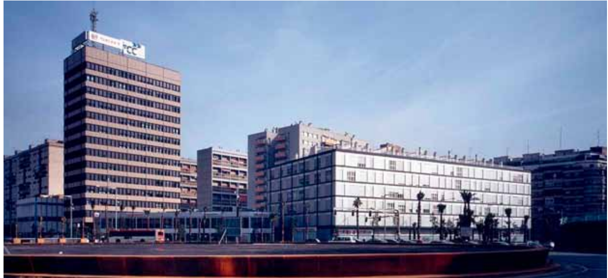
Figura 16. Estado actual de la filial de Barcelona. Imagen cedida por el arquitecto autor de la intervención.

en pie, aunque con serias alteraciones llevadas a cabo por la propia SEAT.